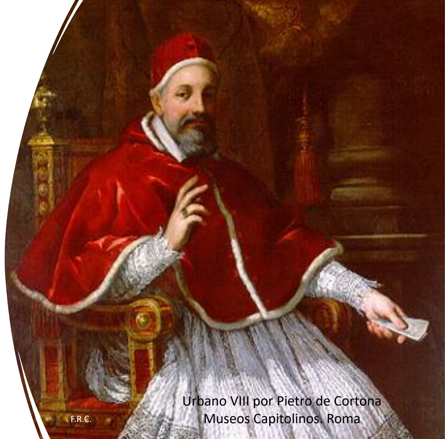
Urbano VIII por Pietro de Cortona Museos Capitolinos. Roma