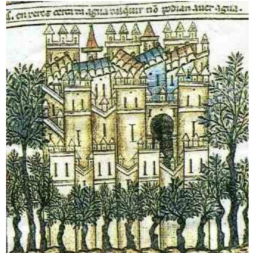
Murallas de Jerez Cantigas de Alfonso X