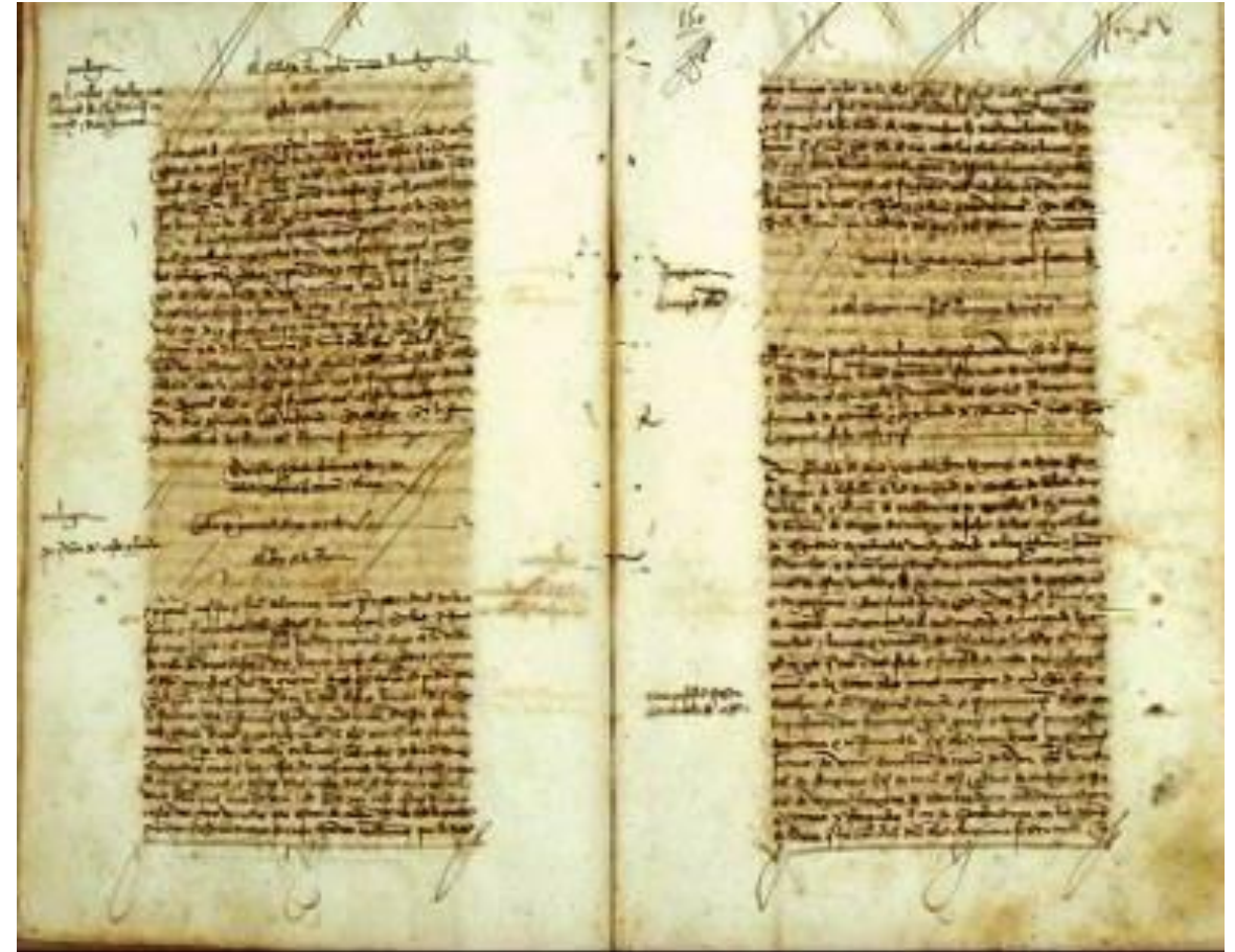
Repartimientos de Málaga