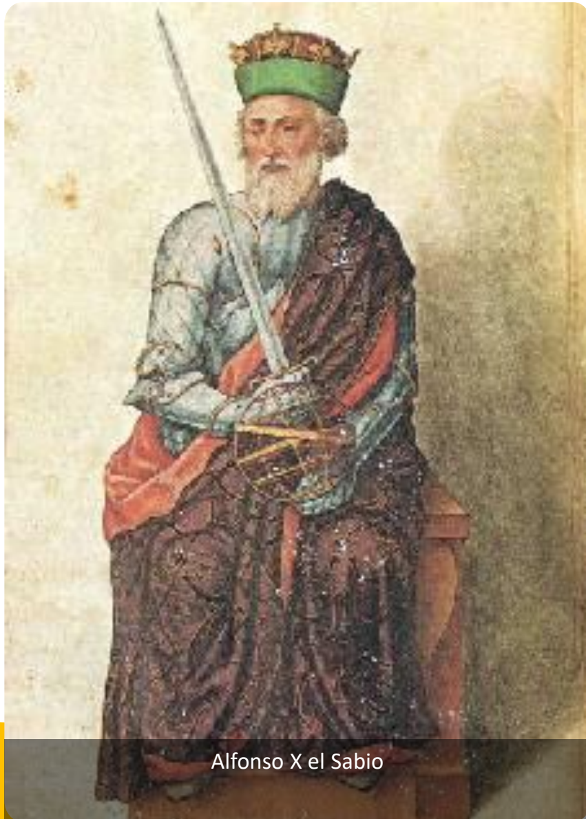
Alfonso X el Sabio