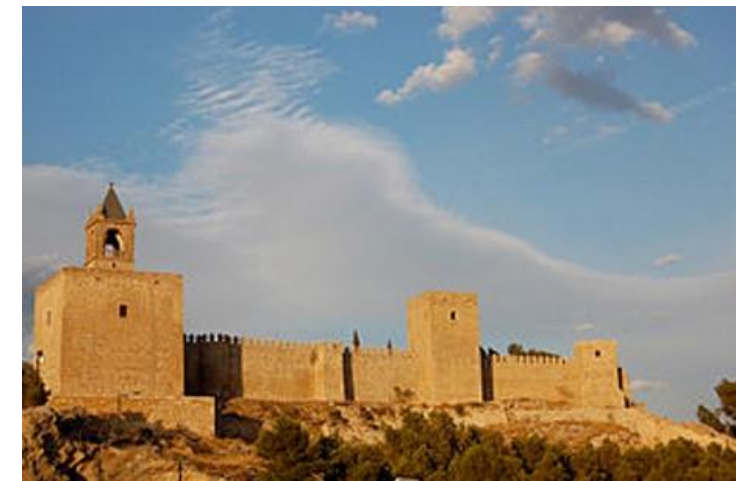
Alcazaba de Antequera