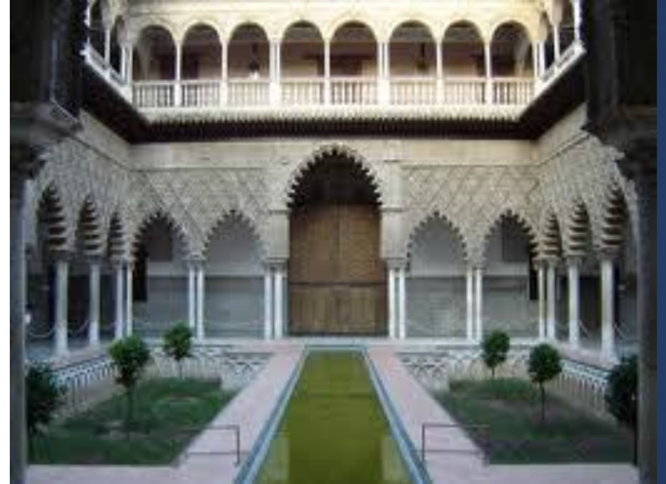
Alcázar de Sevilla Patio de las Doncellas

En el reino de Granada los únicos cristianos eran esclavos