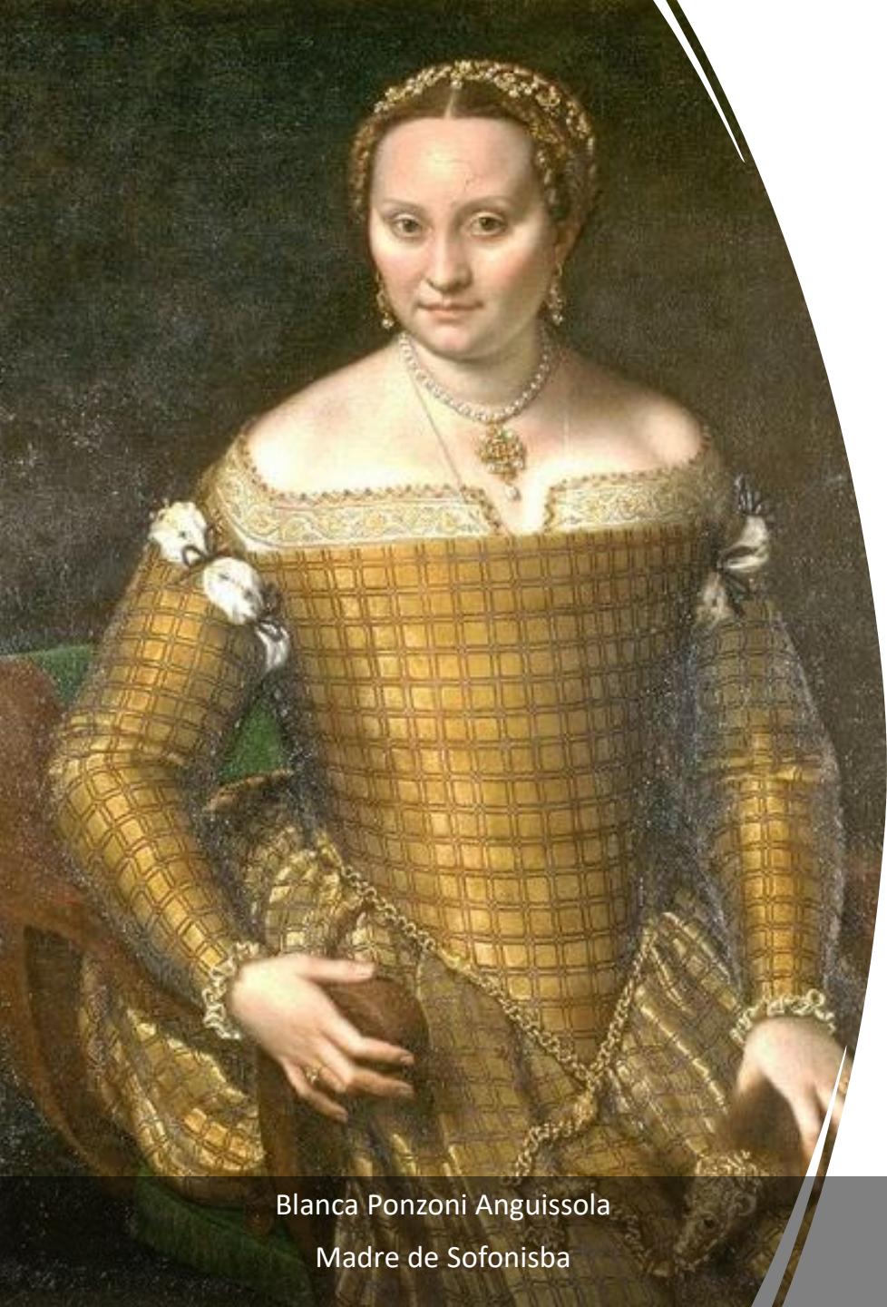
Blanca Ponzoni Anguissola Madre de Sofonisba