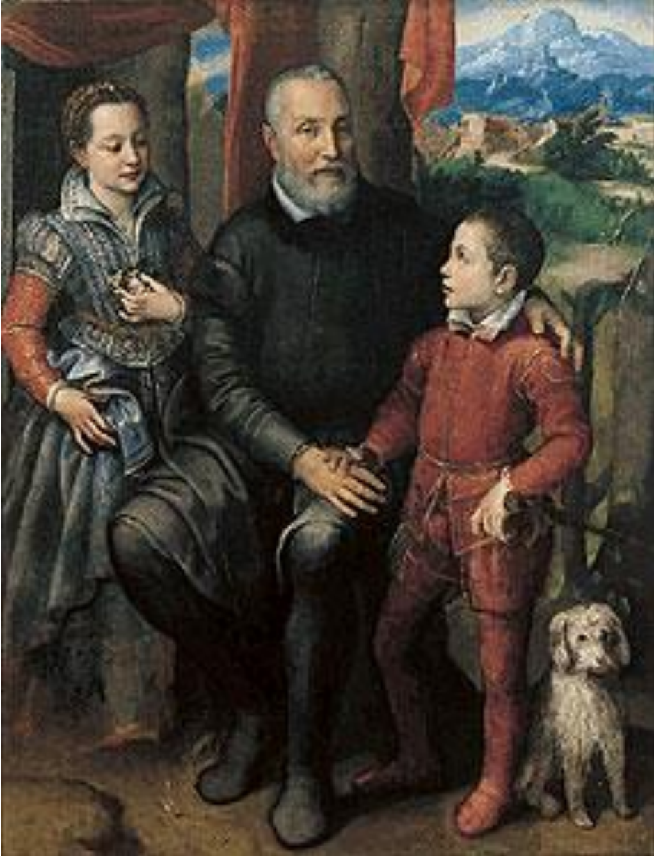
Amílcar Anguissola, Minerva y Asdrúbal