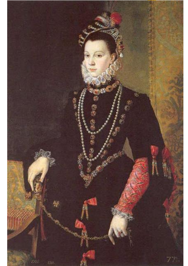
Isabel de Valois