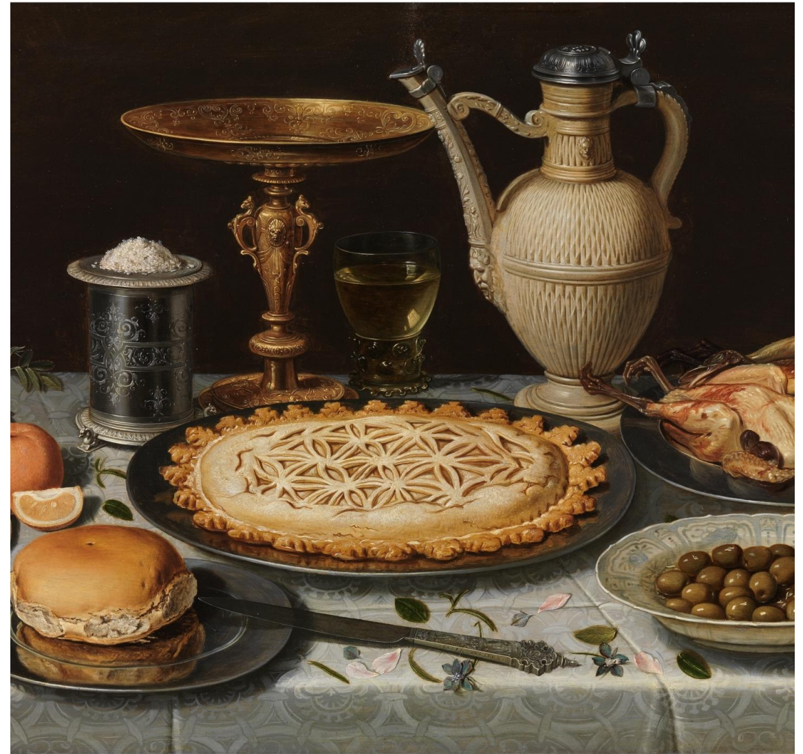
Bodegón. Clara Peeters