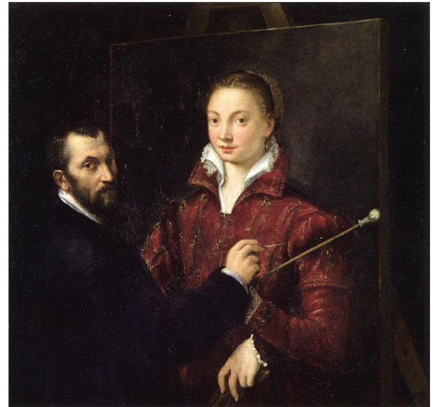
Sofonisba pintando a su maestro Bernardino Campi