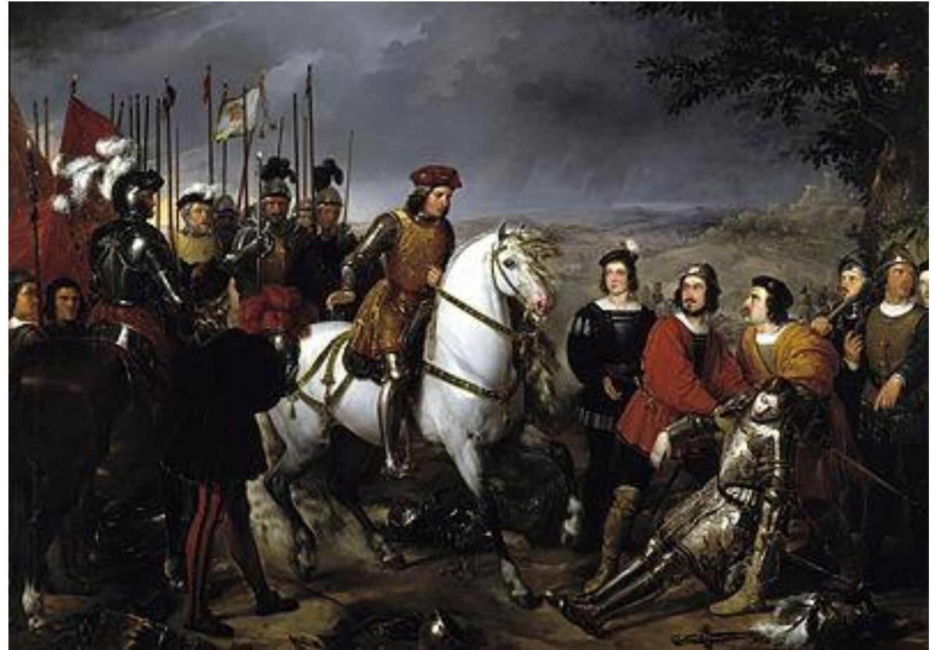
El Gran Capitán ante el cadáver del duque de Nemours. Federico Madrazo