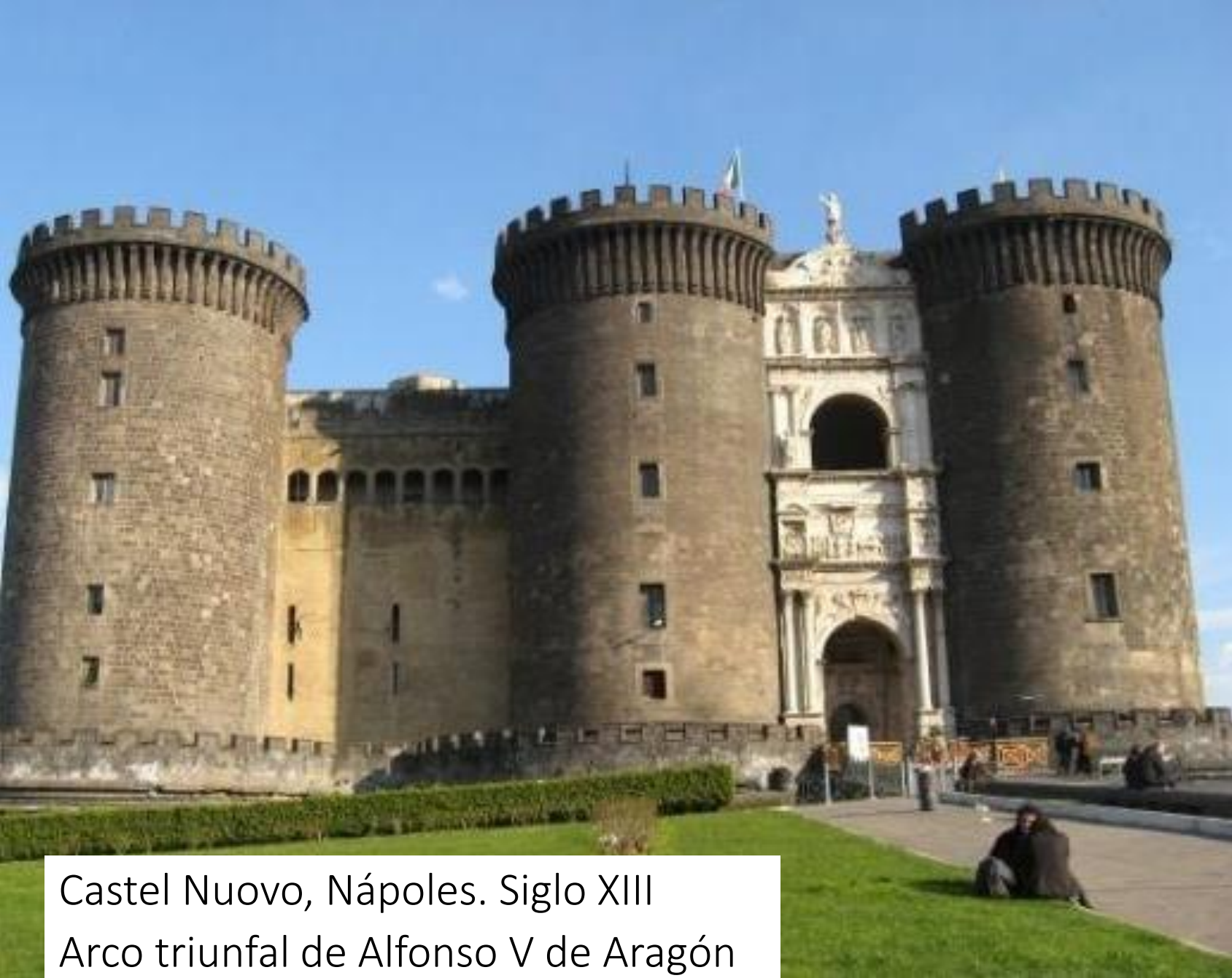
Castel Nuovo, Nápoles. Siglo XIII Arco triunfal de Alfonso V de Aragón