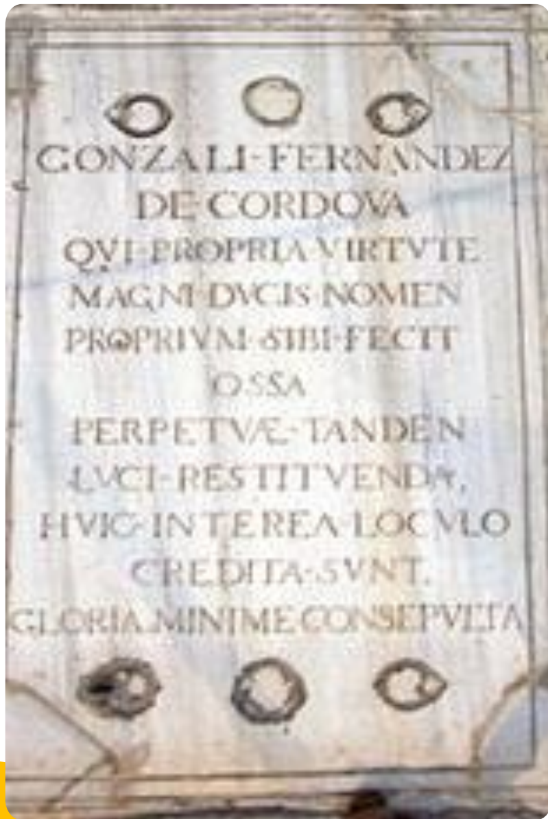
Lápida de Gonzalo Fernández de Córdoba Monasterio de San Jerónimo de Granada