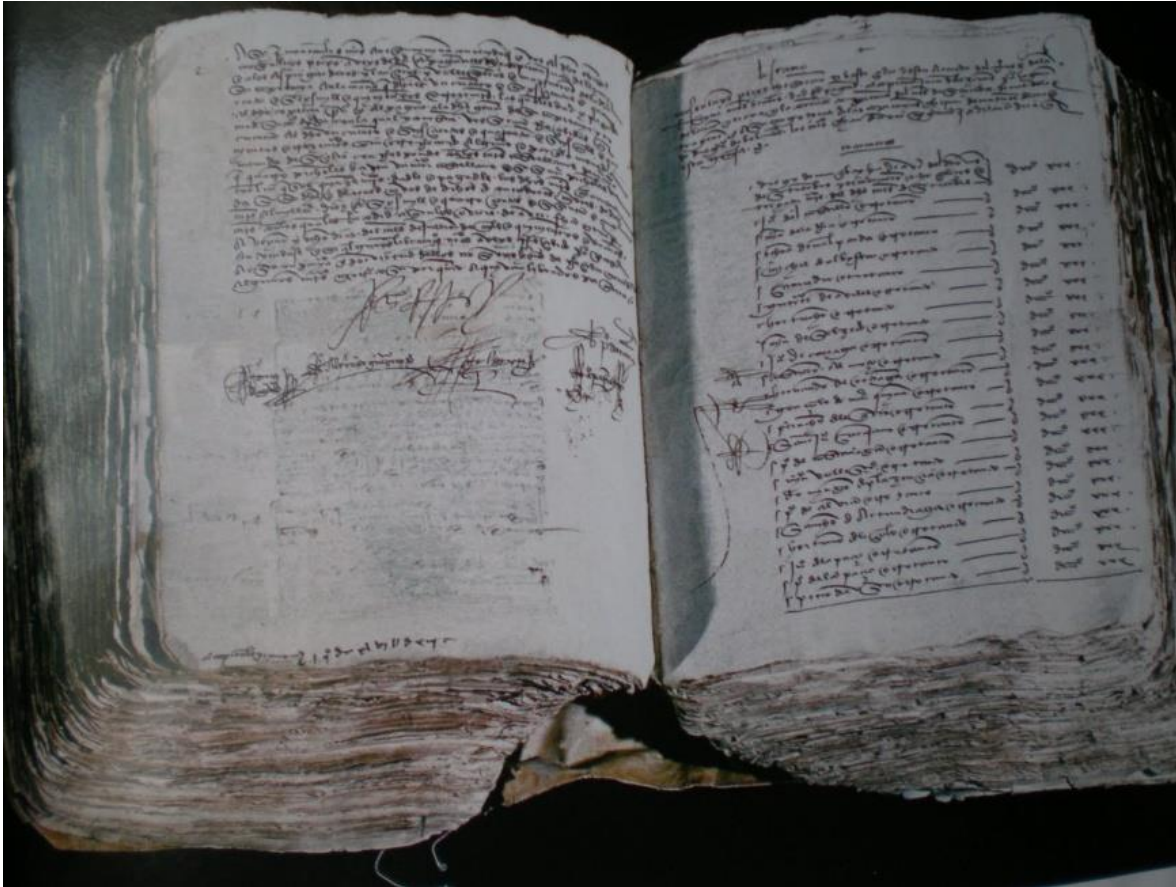
Las cuentas del Gran Capitán