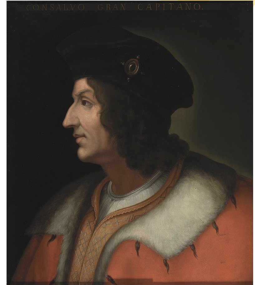
Representación habitual (poco fiable) del Gran capitán. Museo del Prado